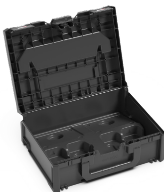
AUSLIEFERZUSTAND: MIT EINLAGE, OHNE AKKUS UND OHNE LADEGERÄTE