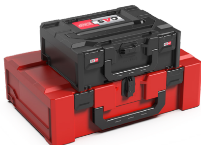
MALLETTE [UN] CAS M145S CONNECTÉE À LA METABOX 185XL