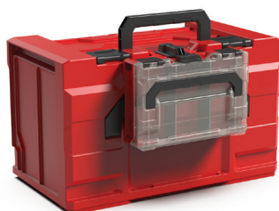
META BOX 63XS VERBUNDEN MIT DEM META BOX 280L KOFFER